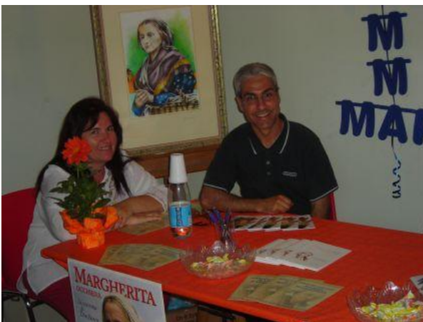
Gli amici della Associazione Mamma Margherita

Abbiamo conosciuto Aviatori dell'Aeronautica Militare con esperienza di Marconista di Bordo e li abbiamo invitati a studiare con noi per conseguire la Patente di Radioamatore. Ci è sembrato di cogliere nei loro occhi un lampo di nostalgia alla vista dei nostri tasti e dei nostri apparati. Speriamo che decidano positivamente.