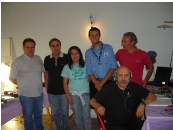
IS0XDA, Aldo, IS0UOL, IS0NRH, IS0FQK, IS0SDX

Eppure, nella maggior parte dei casi, una Associazione nasce perchè un bel giorno alcune persone si sono incontrate per fare qualcosa di buono per la società, per il futuro, anche per se stessi, e allora possiamo notare quanto siano simili le nostre motivazioni profonde, pur avendo ognuno il proprio stile nel proporle. Ecco, questo senso di condivisione di vedute è la bella sensazione che ci è rimasta dalla nostra partecipazione alla Tre Giorni Selargina.