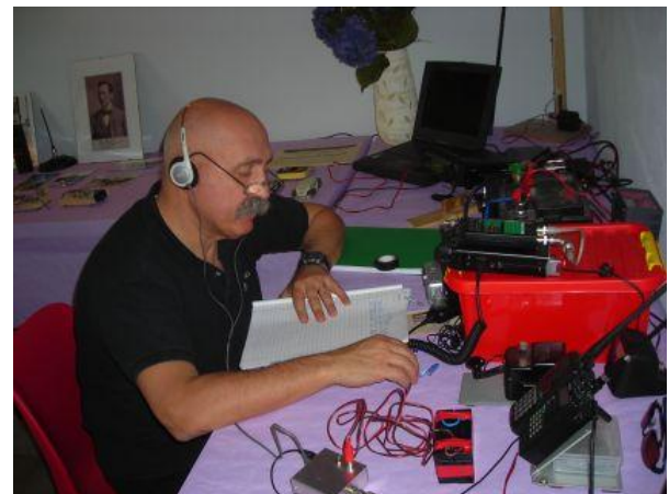
Capo Nonnis IS0SDX al tasto

Non smetteremo mai di dire che la telegrafia, per chi la ama, è musica, non un retaggio del passato.